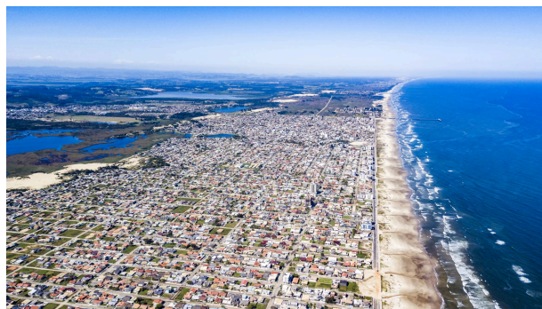
Figura 04 - Vista aérea do município de Balneário Rincão

Balneário Rincão é um município litorâneo de recente emancipação, com raízes nas atividades pesqueiras e rurais dos povos indígenas. Com o tempo, a região se transformou em um destino de veraneio, e "Rincão Comprido" passou a ser chamada de "Praia do Rincão", atraindo pessoas de diversas origens e culturas. Sua história começa em 1999, quando foi constituído como distrito de Içara, mas o desejo de se tornar município levou a população a um plebiscito. Com ampla aprovação, Balneário Rincão foi oficialmente criado em outubro de 2003 pela Lei estadual nº 12.668, mas só se emancipou de fato em 2013, após a promulgação da PEC dos municípios. Hoje, o município investe em infraestrutura, oferecendo qualidade de vida e atrativos para turistas, como é possível observar na imagem da orla abaixo.