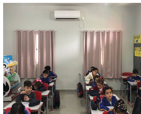
Figura 2: Aquisição de cortinas para todas as salas