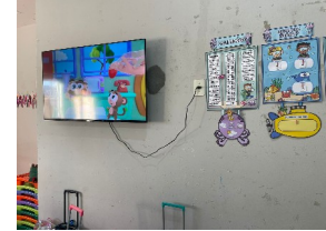
Análise dos impactos

das ações implementadas e considerações sobre o alcance das metas e possíveis áreas de melhoria identificadas.