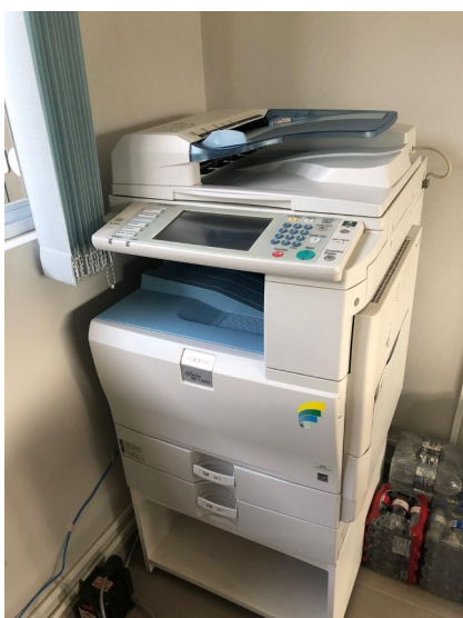
Figura 1: Aquisição Máquina Impressora Profissional

Aquisições obtidas nesse período de tempo na unidade escolar. Além de reuniões