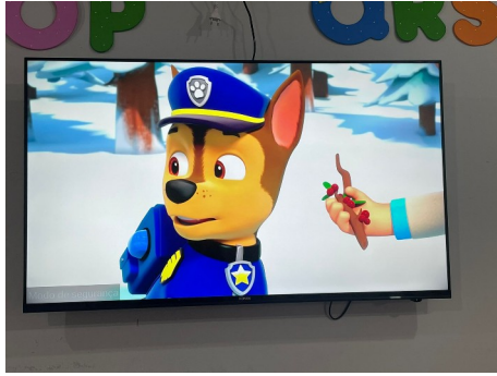
Figura 7: Aquisição de televisores para o Berçário